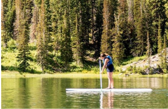
Tabla de remar parado

Aprobación del consejo local: sí se requiere